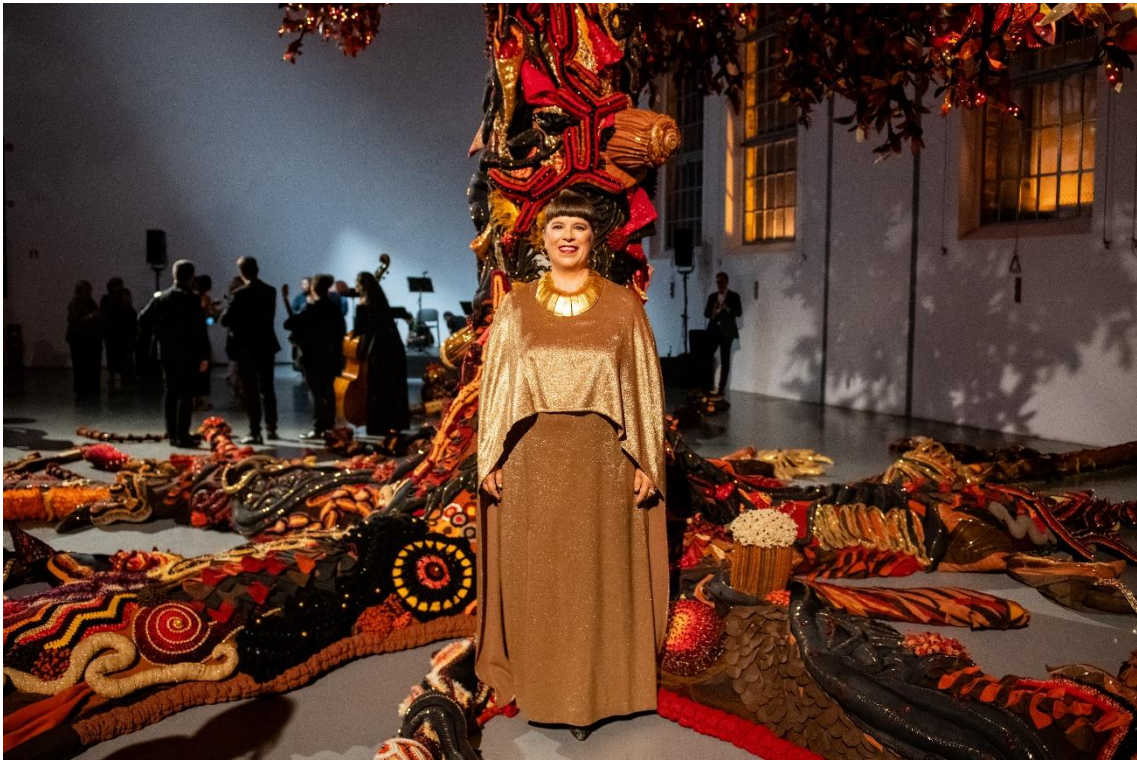
Joana Vasconcelos.

Artista visual con una larga y reconocida trayectoria. El reconocimiento internacional llegó en 2005 con A Noiva en la primera Bienal de Venecia comisariada por mujeres, donde ha regresado tres veces hasta la fecha, en 2013 al frente de Trafaria Praia como Pabellón Portugués, el primer evento flotante del evento. La artista más joven y la primera mujer en exponer en el Palacio de Versalles; En 2012, su exposición fue la más visitada en Francia en 50 años, con un récord de 1,6 millones de visitantes. En 2018 se convirtió en la primera artista portuguesa en exponer individualmente en el Guggenheim de Bilbao, la cuarta mejor ese año para The Art Newspaper y la tercera más visitada en la historia del museo. En 2023, logró el honor de exponer en las Galerías Uffizi y el Palacio Pitti, en Florencia, junto a los maestros clásicos Leonardo Da Vinci, Miguel Ángel y Caravaggio.