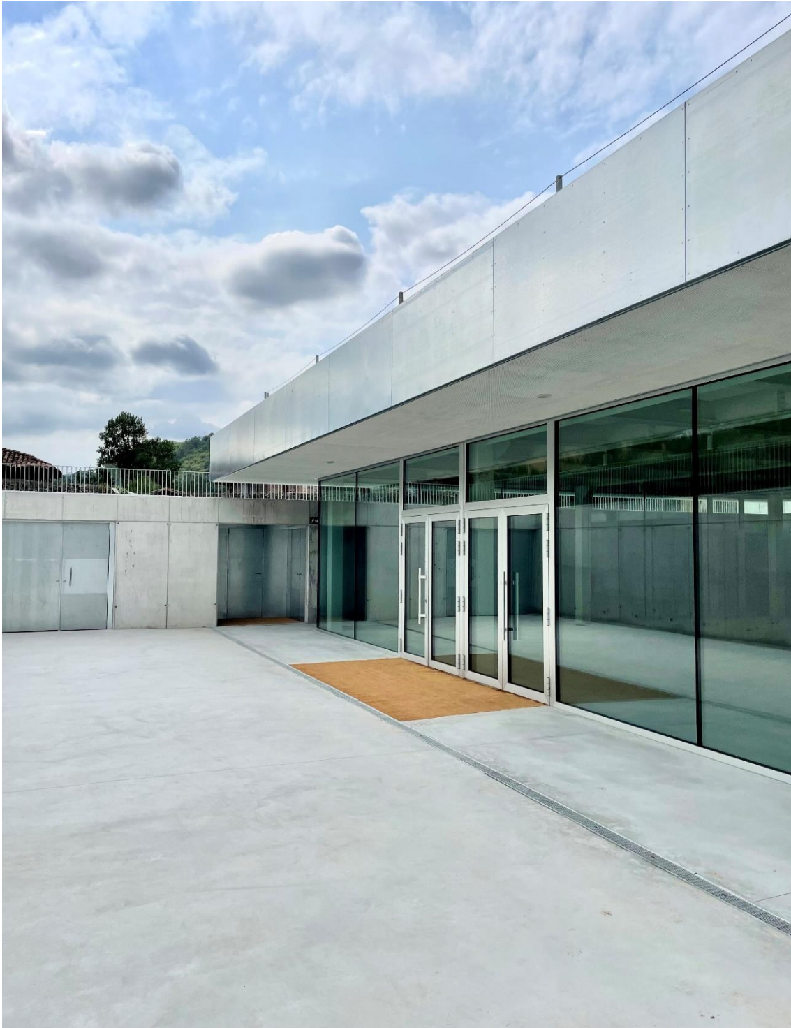
Imagen del exterior de la Central Artística de Bueño. 2023. MN+LM Arquitectos. En portada: Imagen del exterior de la Central Artística de Bueño. 2023. MN+LM Arquitectos.