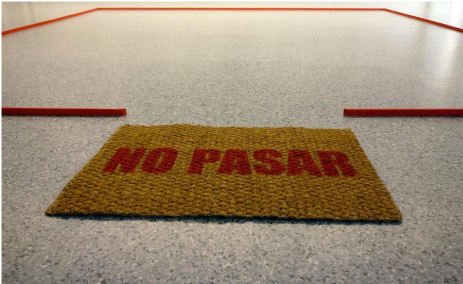
Fuera de lugar , Serigrafía sobre felpudo y cinta de señalización. Instalación medidas variables.