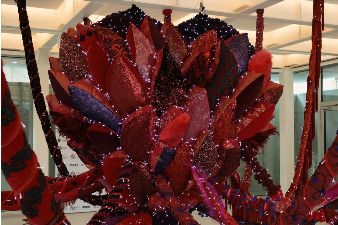
La Pasionaria, 2024.