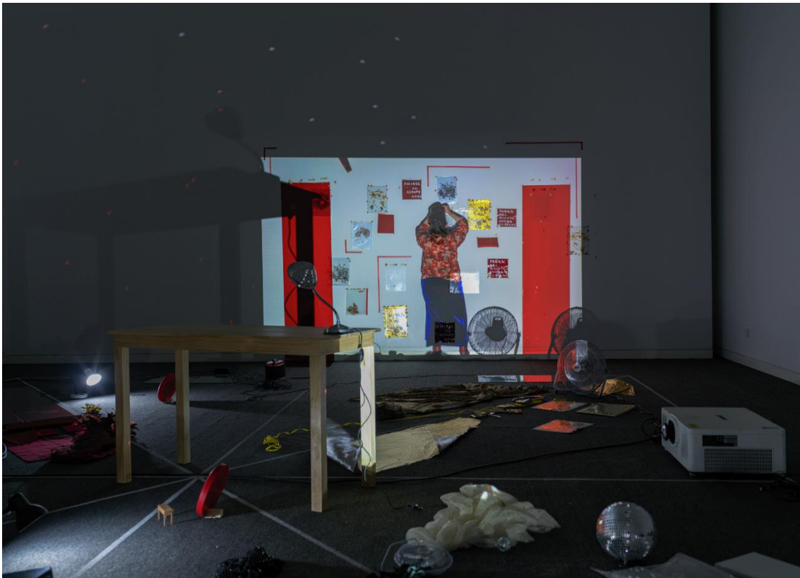
Instalación “Una mesa propia”, en el Museo « By Arts Matters », Hangzhou, China, Mayo 2023.